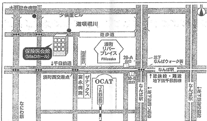
保険医会館ご案内図 (徒歩でお越しの場合)

【徒歩】地下鉄なんば駅下車・地下なんばウォーク街26-A(または30-B)を上る(徒歩5分)