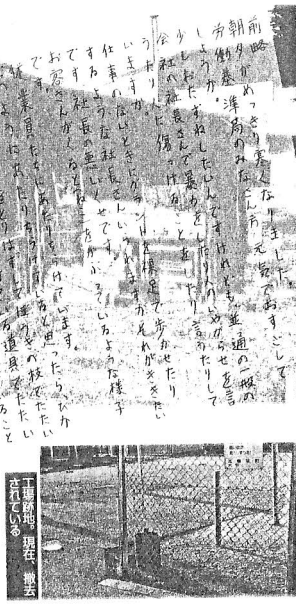
工場跡地。現在建設中