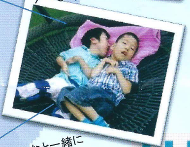
みんなと一緒に 楽しく学習したい