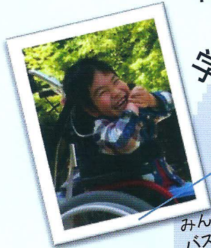
みんなと一緒に バスに乗りたい