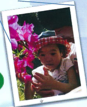
子どもの自立。 親の付き添いを 最小限に。