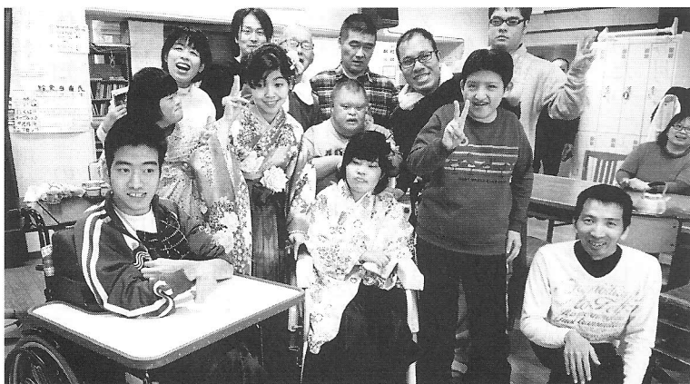
成人式の日、仲間たちと

行くのですが、看護師の帯同がで きない年もあり困っていました。 しかし、東京在住の看護師さんと 繋がりを持つことができ、「一緒 に旅行に行ってもいいよ!」と おっしゃっていただきました。そ の看護師さんにこれまで3回お願 いし、安心して旅行することがで きています。