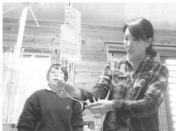
看護師指導で研修中

きるかもしれない」と言ってくださ り、東京都と掛け合ってください ました。すぐには許可されなかつ たそうですが、「STEPえどが わ」のみなさまが何度も交渉し、 スカイプ講習のデモ映像（DVD） を作って説得して下さったので、 スカイプ講習が特例として認め られ、研修が実現したのです!! そのお陰で、5名の非常勤職員が 一度に研修受講可能となり、無事 全員資格を取ることができました。 また、毎年2泊3日で東京、千 葉、新潟等いろいろな所へ旅行に