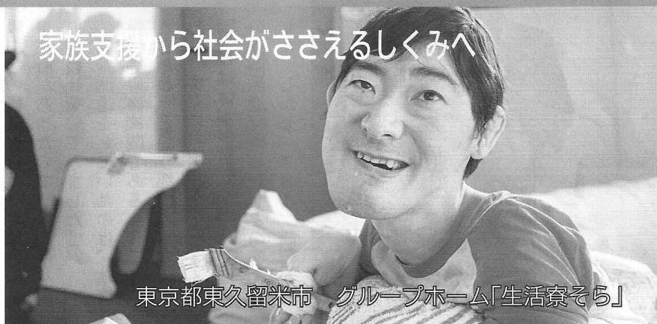
東京都東久留米市 グループホーム「生活寮そら」

グループホーム「生活寮そら」 は、東京都の北側で埼玉県との県 境にある東久留米市にあります。 2004年東京都独自の「重度生 活寮（グループホームの意）制 度」を活用して、「生活寮そら（男